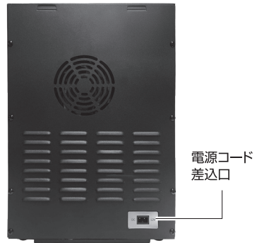
電源コード 差込口